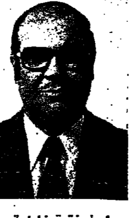
جاء في فترة غلبته برسالة

دراسة وتقديم : خليل عبيص - الناصرة الطير بان الله : معجمة للحرفية والاسمية كقولك : كالكاف ، هجر حرف جر لا محالة لوقوعها في صلة الفاعل وتكون متعلقة بفعل عام .. اسمية بمعنى مثل ، كحذرتنا للجنة السابعة حرت باللي هو مثل الكاف ، وقال امرؤ القيس : وأتك لم يفرح عليك ككافر صيف ولم يفرح بك مثل مغلب والكاف هنا اسم بمعنى مثل وقت ما فعلت للم فعل يفرح ، ولا يجوز أن تكون حرف الذي يليه يفرح ، فإن أريد به غير معين ، أعرب وصف .. ٢ - لا يضاف إلى غير معين أو ضمير كقولنا : من كيفة .. أي متعلق في ذلك الشيء المائل لكيفة الطير ، فيصير ككاسر .. مرت بنا أول من أموس .. توس فيما ميسه المروس ٣ - لا يعرف بال كقولنا : ذهب الأمس وكان أمس طيبا .. ٤ - فرق الجيش ..